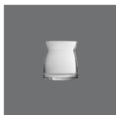
Konfitürentopf Glas , Jam dish glass, Bol à confiture en verre, Mermeladera de cristal, Vaso marmellata in vetro