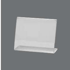
Acryl Aufsteller , Acrylic display, Support en acryl, Display acrilico, Espositore in materiale acrilico