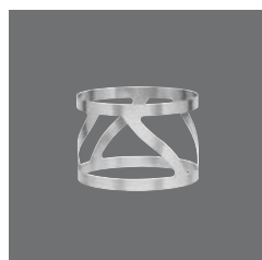
Präsentationselemente, Edelstahl , Elements for presentation, high grade steel, Éléments pour présentation, acier spécial, Base metálica para presentación, Elementi di presentazione acciaio