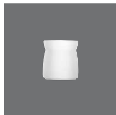
Konfitürentopf , Jam dish, Bol à confiture, Mermeladera, Vaso marmellata