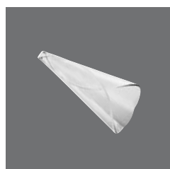
Füllhorn Glas , Horn of plenty glass, Corno d'abondance en verre, Cuerno de abundancia de cristal, Cornucopia in vetro