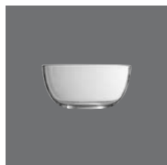
Schüssel Glas transparent , Salad dish glass lucent, Saladier en verre transparent, Ensaladera de cristal transparente, Insalatiera in vetro trasparente