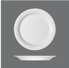
Teller flach Fahne , Plate flat with rim, Assiette plate avec l'aile, Plato llano con ala, Piatto piano