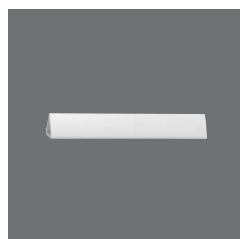
Präsentationselement, Kunststoff , Element for presentation, plastic, Élément pour présentation, plastique, Elemento plástico para presentación, Elemento di presentazione in plastica