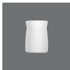
Dressingtopf , Dressing pot, Pot à sauce froide, Recipiente salsa fría, Vaso dressing