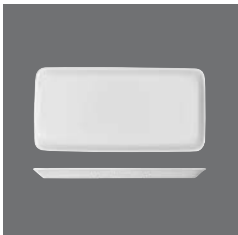
Platte rechteckig , Platter rectangular, Plat rectangular, Fuente rectangular, Piatto quadrato