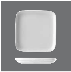
Teller flach quadratisch , Plate flat square, Assiette plate carrée, Plato llano cuadrado, Piatto piano quadrato