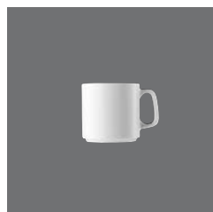
Becher , Mug, Gobelet, Taza mug, Mug